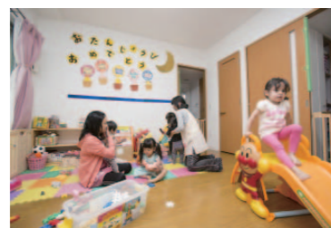
団地の一室を利用した「ちゅーりっぷ保育室」。

ハートアイランド新田は、乳幼児から小学生まで切れ目なく支援が続き、 隅田川と荒川の間位置する足立区新田。この一帯も人口の流入が続き、区立の小中一貫校である新田学園は第2校舎を新設したほど。ハートアイランド新田はグループ保育室や認可保育園、キッズルーム、学童保育室と、子育て支援サービスや施設が切れ目なく用意されている団地だ。 4番街の一室で営まれているのは、「ちゅーりっぷ保育室」。少ない人数の子どもを手厚くみる、保育ママによるグループ保育室だ。10〜16時まで利用できる親子サロンを開設し、定期的に親子教室を開催しているのが「キッズルーム」。UR都市機構が施設を提供、NPOが運営している。