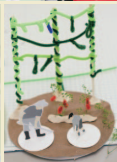
左/こんな庭があったらいいな。参加者が考えた、野菜畑(右)やハンモック(左)。