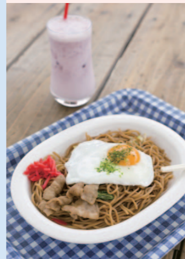
とろりとした半熟卵を絡ませた、ご当地グルメ「石巻焼きそば」。

女川町の商店街や女川駅はとても綺麗でした。そして、女川町のみなさんがとても温かく出迎えてくださって、うれしかったです！ これから駅の前に商店街ができる予定だと聞いて、自分の目でまちが復興していく姿を確かめたいなあ、と思いました！ 少しでも女川町のみなさんに元気や笑顔をお届けできればいいなあ。また訪問したいと思います！