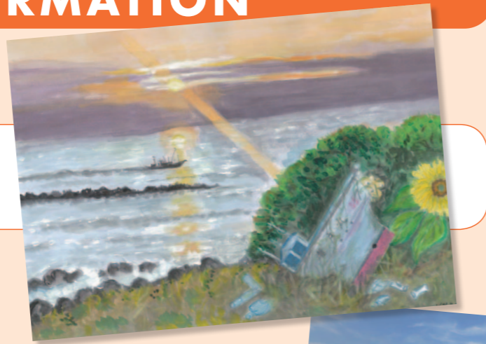
東日本大震災 復興フォト&スケッチ展

UR都市機構では、「東日本大震災 復興フォト&スケッチ展 2015」及び「UR賃貸住宅 団地景観フォト&スケッチ展 2015」という2つの公募展の作品を募集しています。各テーマに合わせて皆さまの写真、スケッチをお寄せください。