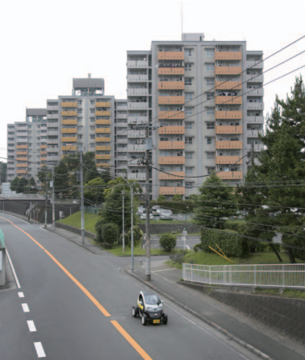
上／前後2人乗りで、坂の多い地域の住民の足としても期待が高まる「超小型モビリティ」。下／祭り会場では展示会も実施。子どもたちも興味津々だ。