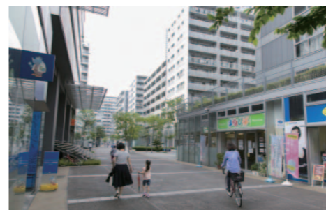
団地の間を通るS字アベニューは車が通らないので、子どもたちにも安心。この左右の建物の1階に子ども向けの施設が集中している。

東京に残された貴重な海辺。お台場海浜公園は潮風が身近に感じられる人気スポット。すぐお隣にあるのがシリアお台場だ。この団地も子育て世帯が全体の約2〜3割と他の団地より多く、子育て支援に力を入れている。