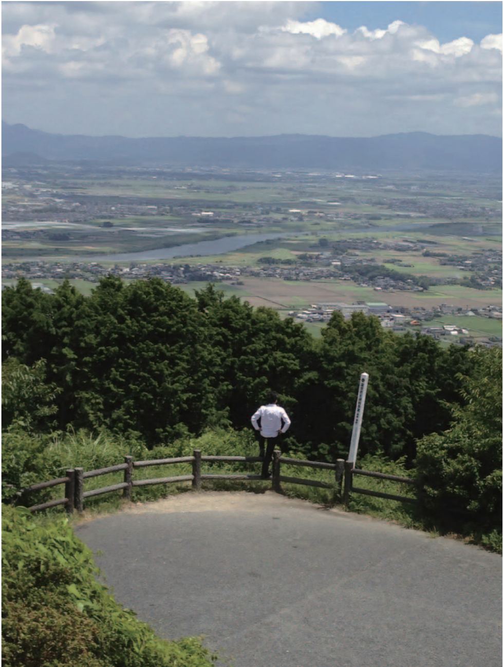
高良山から眺める故郷・久留米と筑後川。