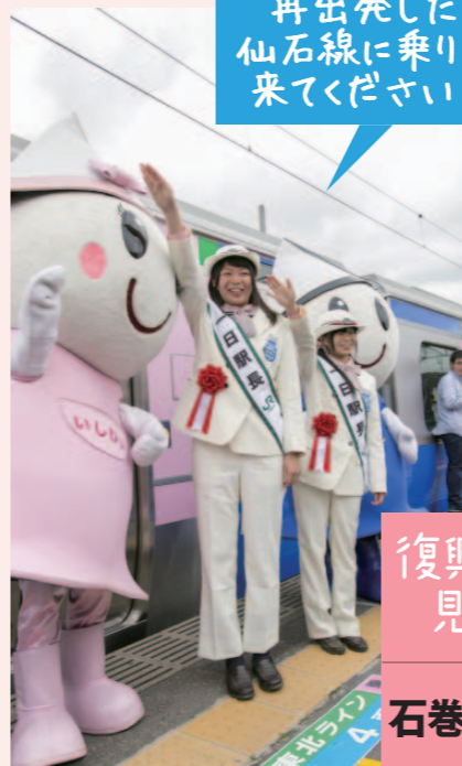
石巻駅での出発式。一日駅長を務める高校生とご当地キャラのいしびよんず。仙石東北ラインは、ディーゼルエンジンと電気モーターを組み合わせたハイブリッド車両。