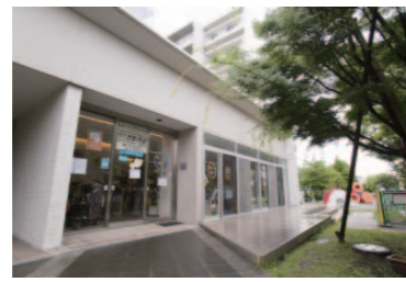
キッズルームは誰でも出入りしやすいように、バス通りに面している。

いる。コーディネーション親子体操教室に参加したママは、「新田は本当に子育てがしやすい」とこりこり。「ここに来ればママたちもつながれる。一時預かりなどさまざまなサービスを利用しています」。「ハートアイランド新田学童クラブ」は、団地の集会所を改装して4年前に始まった。NPOワーカーズグループが運営する。小学生たちの元気な声が響く東京の団地、そこには明日への活力が満ちていた。