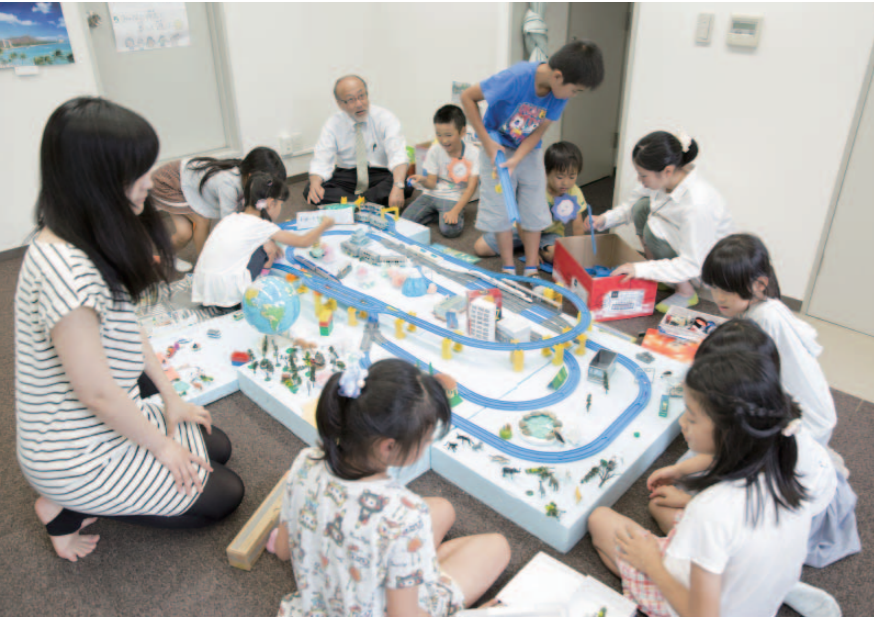
学年もさまざまな小学生たちが集まって、プラレールを走らせたり、ジオラマでまちを作ったり。このプロジェクトは全部で15回行われる予定。