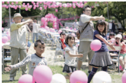
5月10日に団地に隣接する公園で開かれた「青山台これからの50年キックオフ・フェスティバル」。ストレッチ体操から始まり、持ち寄ったお弁当で昼食会、吹田市消防音楽隊の演奏会、ヒップホップダンス教室など盛りだくさん。子どもたちには昔ながらのゲームも用意され、お年寄りからちびっまでたくさんの方々が参加してにぎわった。