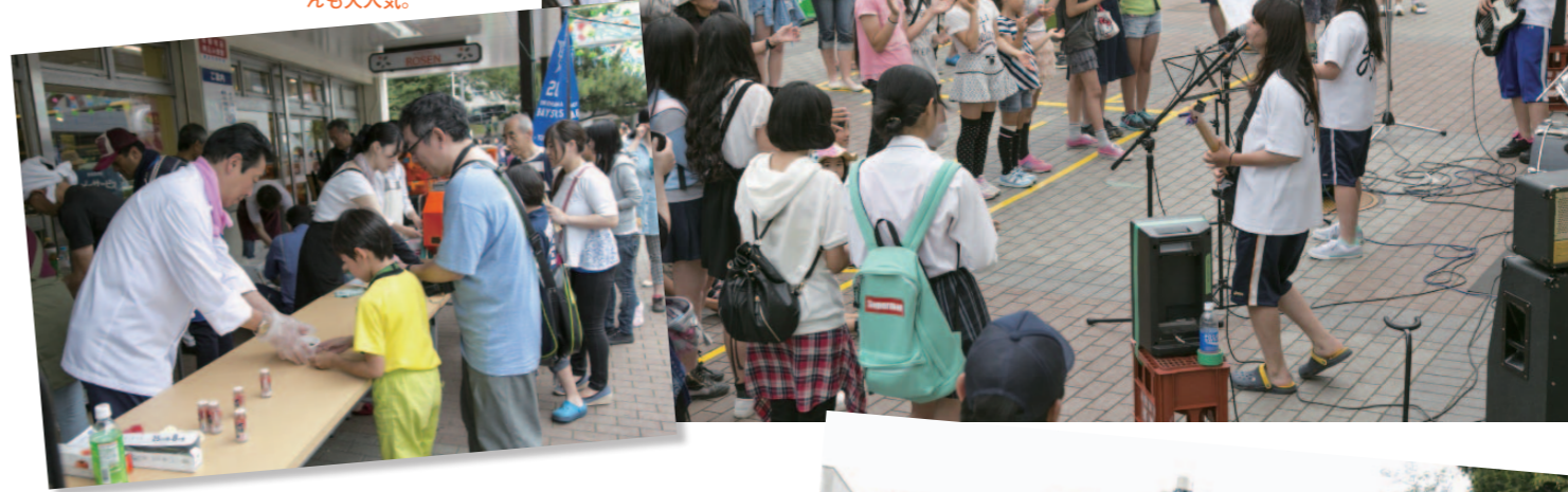
右／ハーフタイムライブには左近山中学卒業生のバンド「神'S」(ゴッズ)が登場。育ててもらった地域への思いを語りながら歌い続け、盛り上がった。下／抽選付きの冷やしうどんも大人気。