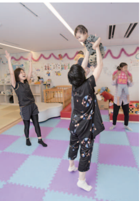
専任コーチが指導する「キッズルーム」のコーディネーション親子体操教室。