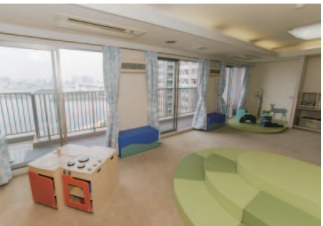
木製のキッチンコーナーなど、ポーネルトの運動遊具が用意されたキッズルーム。