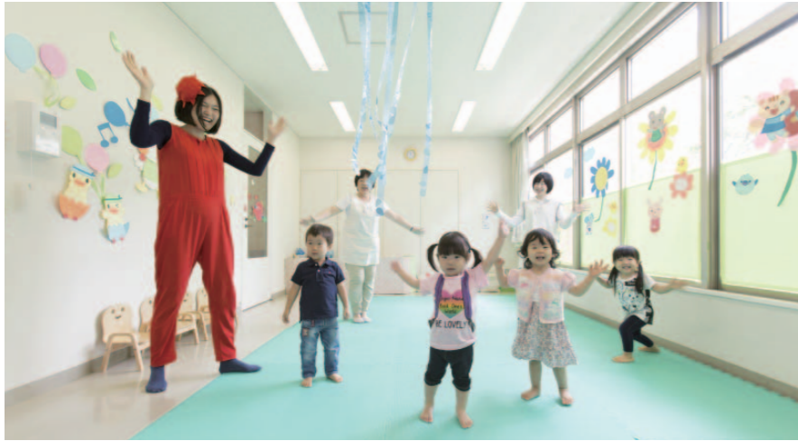
「ぶれきっずお台場」で、英語の歌でダンス！地域に習い事教室が少ないので、託児中に英語を学ばせられればという利用者の声から、この教室が生まれた。