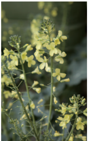
花蕾を収穫しないでおくと、よきよき伸びて黄色い小さな花が咲く。

ブロッコリーはアブラナ科で、収穫が遅れると黄色い花が咲いてしまいます。我が家では、収穫が一段落した後、あえて花を咲かせて早い春を感じています。花は生のままサラダに散らして食卓で楽しむことも。葉は青汁の材料にぴったり。つぼみ、茎、葉、花と全体が楽しめるお得な野菜です。