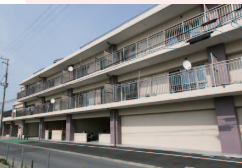
今年3月に完成し、すでに入居している石巻の「大街道西二丁目」災害公営住宅。

仙台と石巻を結ぶJR仙石線が、東日本大震災から4年2カ月ぶりに全線復旧した。被害が甚大で運休していた高城町駅と陸前小野駅間の運転が再開されたのだ。5月30日には、UR都市機構が復興まちづくりを支援する石巻市、東松島市の石巻駅と野蒜駅で記念式典が開催され、沿線地域は喜びに包まれた。