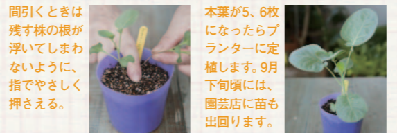
間引くときは残す株の根が浮いてしまわないように、指でやさしく押さえる。

Step 1 ポットに培養土を入れて4粒程度種をまきます。本葉が2枚出たところで間引いて2株にし、本葉3、4枚でさらに間引いて1株にします。ほかの植物を育てているプランターの土の上にポットを置くなどして、暑さから守ってあげましょう。