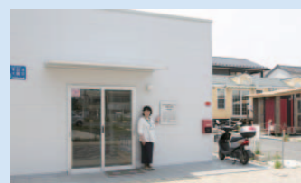
石巻市内の橋通りCOMMONに隣接する「石巻市復興まちづくり情報交流館中央館」では、被災記録や復興事業の進捗状況についてはパネルで、まちの将来像については模型で展示している。

◆観光・物産などの問合せ 石巻観光協会 ☎0225・93・6448 東松島市観光物産協会 ☎0225・87・2322