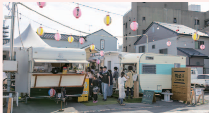
コンテナは、東京・表参道の「246コモン」から譲り受けたものを利用。

4月、石巻の市街地に「橋通りCOMMON(コモン)」が誕生した。「食を通じた新たな暮らしの提案と発見の場」をめざす仮設商店街だ。地元の人々が集い、ゆるやかにつながる場として注目を集めている。