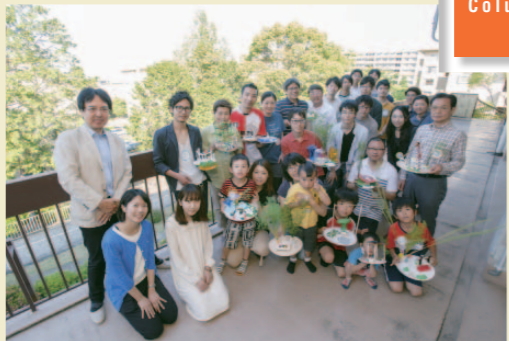
みんなで考えた「みんなの庭」を手に、参加者全員で記念撮影。