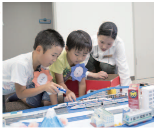
右/プラレールをうまく走らせようと、子どもたちは夢中だ。