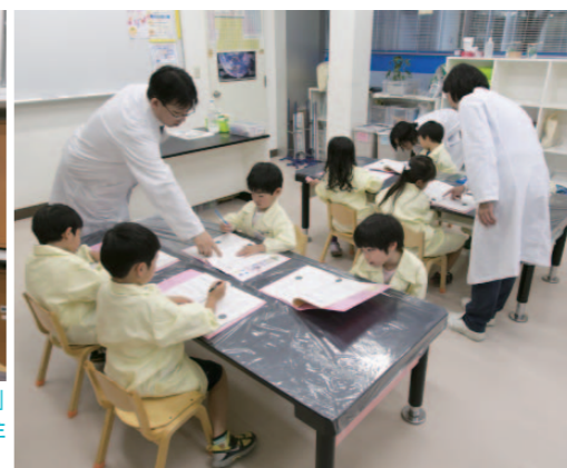
実験に夢中になる子どもたち。「サイエンス倶楽部」豊洲教室の会員のうち、キャナルコート東雲の居住者は約1割、9割は近隣地域から通ってくる。

東京オリンピック・パラリンピックの主要施設が集中する湾岸地域は今、東京で最もホットなエリア。なかでも江東区は東京都のなかで一番人口が増加しており、増える子どもに小中学校の新設が追