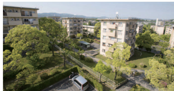
千里ニュータウンが誕生したときの風景を今も残す千里青山台団地。棟間の間隔が広く、風がよく通る。

千里青山台団地は丘陵地の勾配を生かした広大な敷地に、ゆつたりと各棟が立ち並ぶ。枝を伸ばした木々がさわやかな緑陰をつくり、団地全体に大人の風格がある。居住者の高齢化は進んでいるが、古い住戸の仕様を生かしながら今の暮らしに合う「MUI×UR」や「暮粹(くら・しつく)」といったリノベーション住戸をつくり、若い世代も呼び込んでいる。