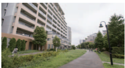
荒川の河川敷がすぐそばで、東京とは思えない自然にあふれている。

いる。コーディネーション親子体操教室に参加したママは、「新田は本当に子育てがしやすい」とこりこり。「ここに来ればママたちもつながれる。一時預かりなどさまざまなサービスを利用しています」。「ハートアイランド新田学童クラブ」は、団地の集会所を改装して4年前に始まった。NPOワーカーズグループが運営する。小学生たちの元気な声が響く東京の団地、そこには明日への活力が満ちていた。