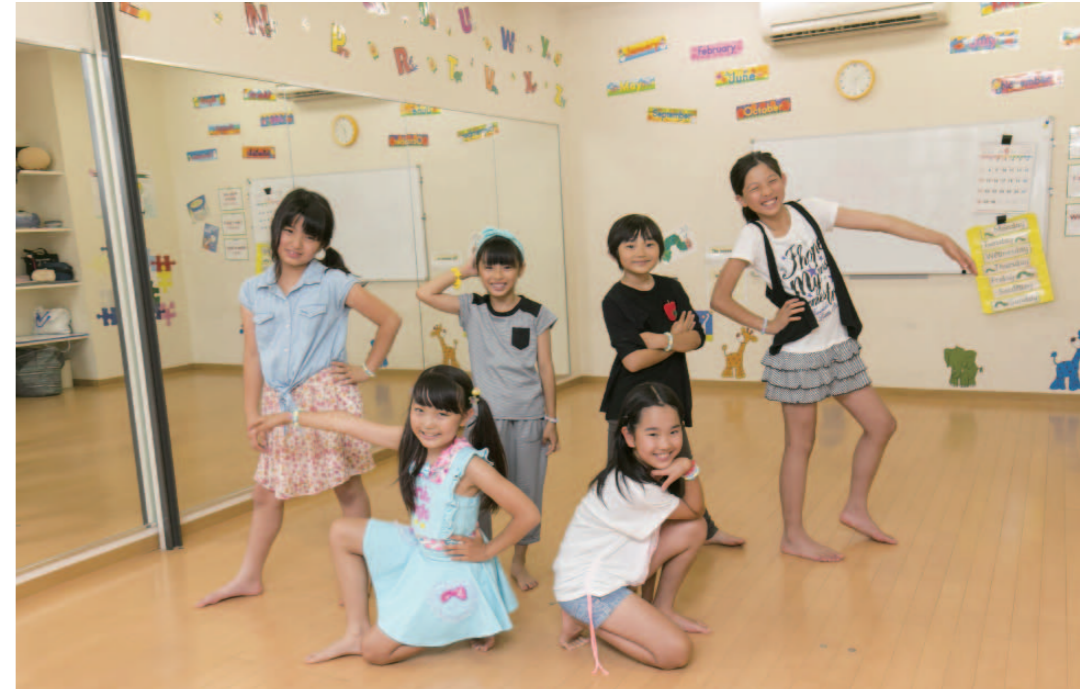
東雲キャナルコートCODANにある「まなびば」で人気のHip Hop教室。「まなびば」では英会話を中心にそろばんやアート、ジャズダンスなどの教室を開催している。