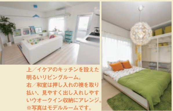
上／イケアのキッチンを設置した明るいリビングルーム。右／和室は押し入れの襖を取り払い、見やすく出し入れしやすいウォークイン収納にアレンジ。※写真はモデルルームです。

機能的なイケアのキッチンを備え、白木調のフローリングに壁を白でまとめた明るいLDK。襖や仕切りを取り去ったクローゼット風スペースを備えた和室など、オシャレで快適な住まいだ。若い夫婦を中心に人気が高いイケアのキッチン付き住戸を今後、さらに増やしていく予定だ。