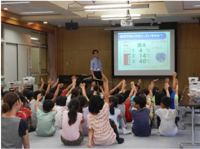
元気よく手を挙げる子どもたち