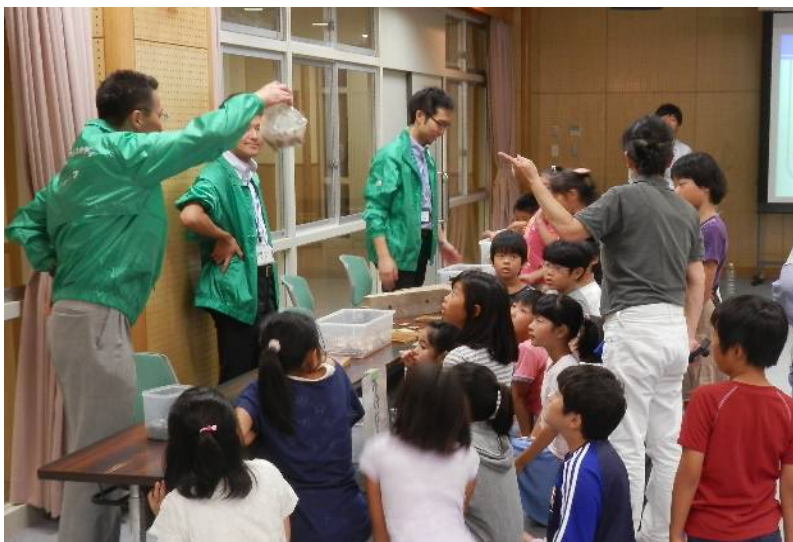
展示コーナーの様子