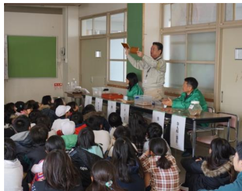
クイズに答える子供たち