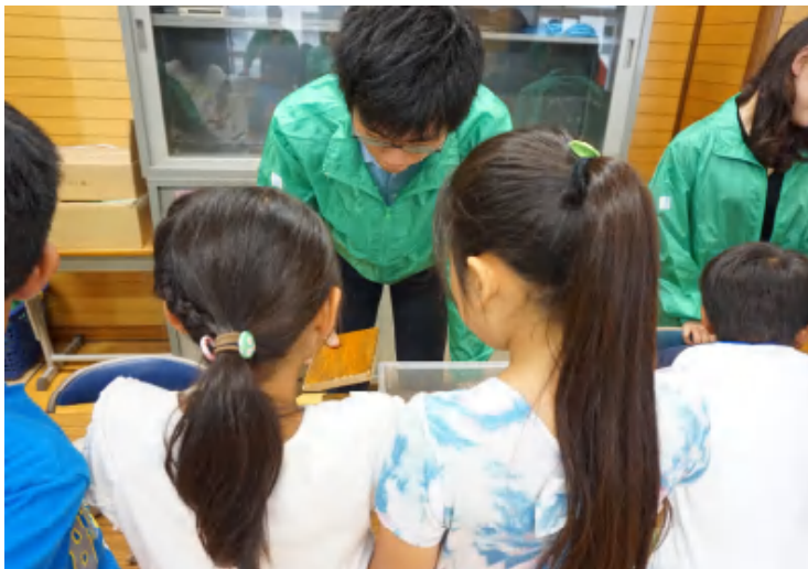
展示コーナーの様子