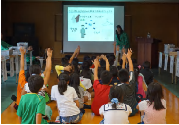
クイズに答える子供たち