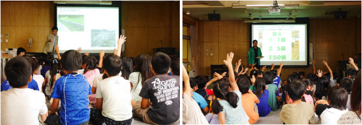
元気よく手を挙げる子どもたち