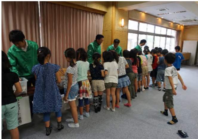
展示コーナーの様子