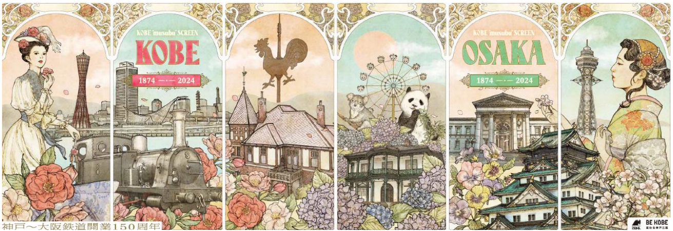
神戸～大阪鉄道開業150周年