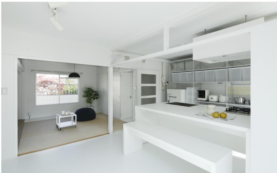
写真：京都市伏見区 桃山南団地 プラン Re+006

(※) 「MUJI × UR 団地リノベーションプロジェクトの詳細については、別添をご覧ください。