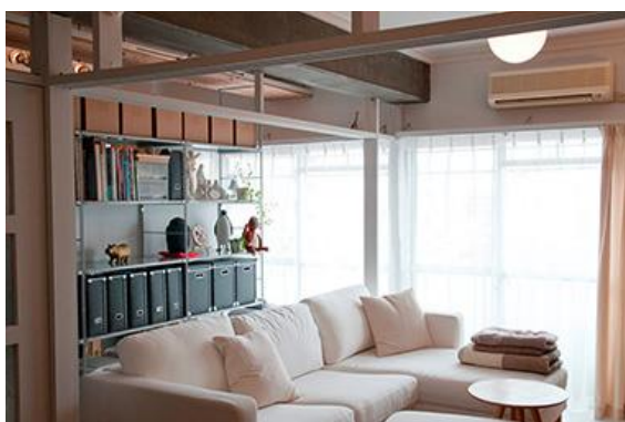
リバーサイドしろきた団地