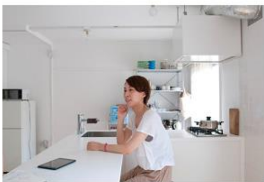
泉北茶山台二丁団地