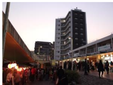
男山地域秋祭りの賑わい