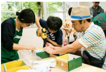
DIY 体験コーナーイメージ