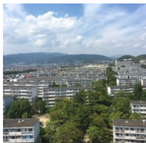
展望室から望むココロミタウン