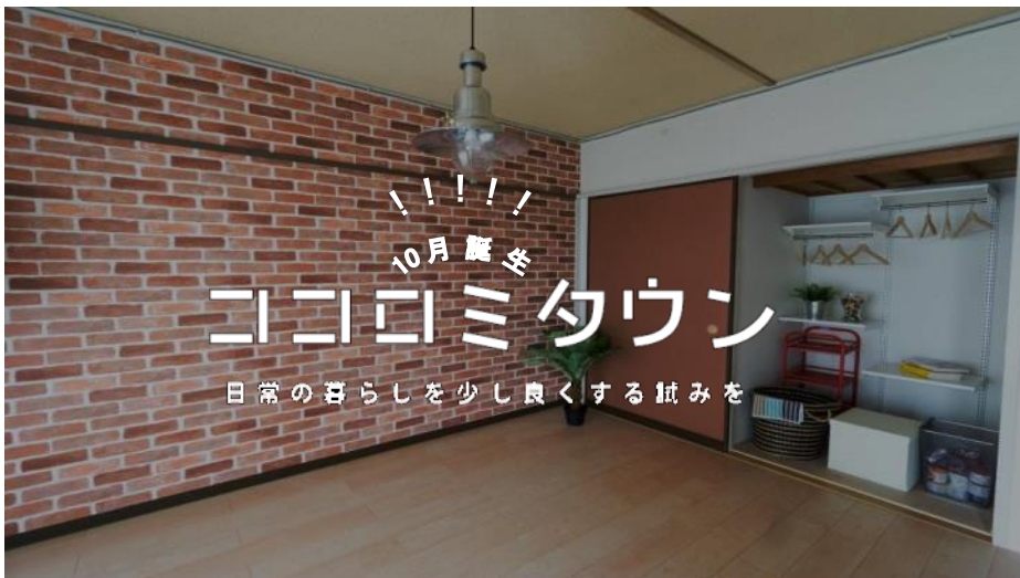
居住中の方向けイメージモデルルーム (C02-402)

このたび、UR都市機構男山団地内のC地区全体を、居住者自らが自分好みの住宅に改修可能な初のセルフリノベーション特区に指定し、「ココロミタウン」として、入居者の募集を開始することとなりました。