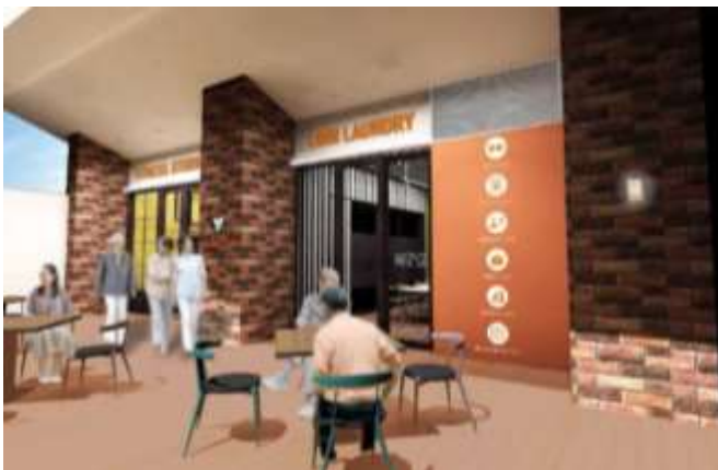
「クイックドライフィット」外観イメージ