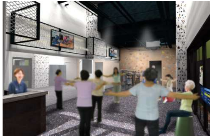
店内イメージパース

7月29日のオープン当日は、「大正クラフトライフマーケット」を開催（参考資料1）します。フィットネスの無料体験やDIYに関するワークショップや雑貨販売など様々な催しを実施する予定です。また、当日は、報道関係者向けの内覧会を実施します。 取材をご希望の場合は、取材申込書にてご連絡ください。