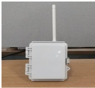
専用送信機(実験用)