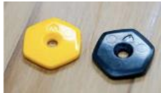
▲検証で使用するICタグ