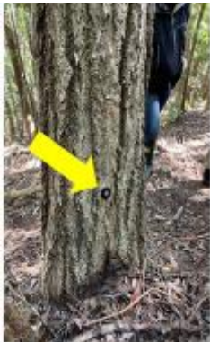
▲ICタグをはめ込んだ樹木

UR森之宮第2団地内の動線沿いの常緑樹、落葉樹、針葉樹を含む代表的な大径木40本を対象に、ICタグ(NFCタグ)を取り付ける。専用のスマートフォンアプリを使用し、ICタグを読み取ることで、対象樹木の位置情報や過去の調査データの呼び出し、形状寸法や健康状態を入力する。また、入力されたデータはクラウド上のデータベースへ自動的に保存される。入力されたデータを活用し、樹木台帳や樹木位置の図化を出力する。実証実験では、樹木の健康状態を適切に評価するために必要な入力項目や、システムの稼働状況、関係者間の情報共有の容易さ、樹木台帳などシステムが出力する資料の質を検証する。さらに、ICタグの材質劣化や取り付けに関する課題も抽出する。