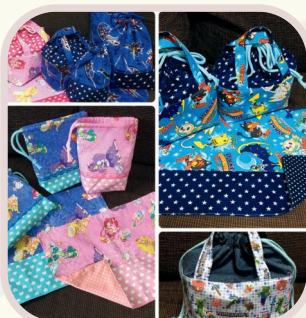
ハンドメイドグッズ販売 連合子供会さんのブース