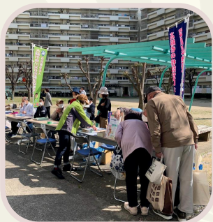
淀川区社協さんのよろず相談ブース