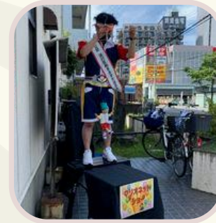
マッキーの マリオネットショー