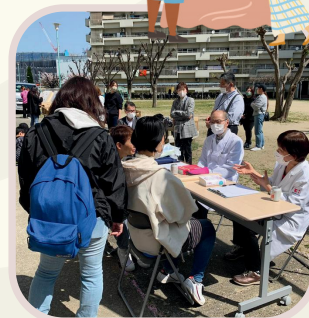
薬剤師会さんのお薬相談ブース