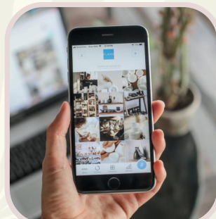
スマホ相談ブース 個別の相談ができます