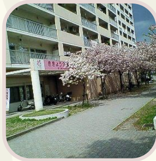
ききょう介護サービスさんのブース