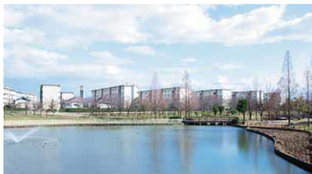
大阪府堺市 白鷺団地

大阪府堺市 白鷺団地が1年間家賃無料 本日から3/9（水）までWEBサイト上にてご応募受付中