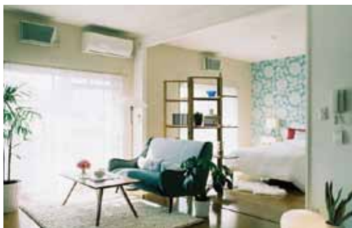
DESIGN SELECT アーベイン東三国

築年数の経過した多くの団地では、住民の高齢化が進んでいます。 URでは、これらの団地に若い世代にもお住まいいただき、 多世代共生による団地のコミュニティや周辺エリアの活性化に取り組んでいます。 その取り組みのひとつとして、若い世代の方々にも 快適にお住まいいただくことができるように、 多くの団地で空室のリノベーションを実施しています。