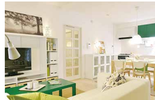
イケアとURに住もう さざなみプラザ第7