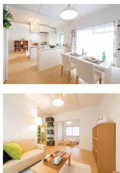
リノベーション住宅