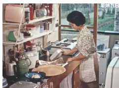
上映会 「団地への招待」