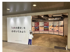
URまちづくり ヒストリー展示