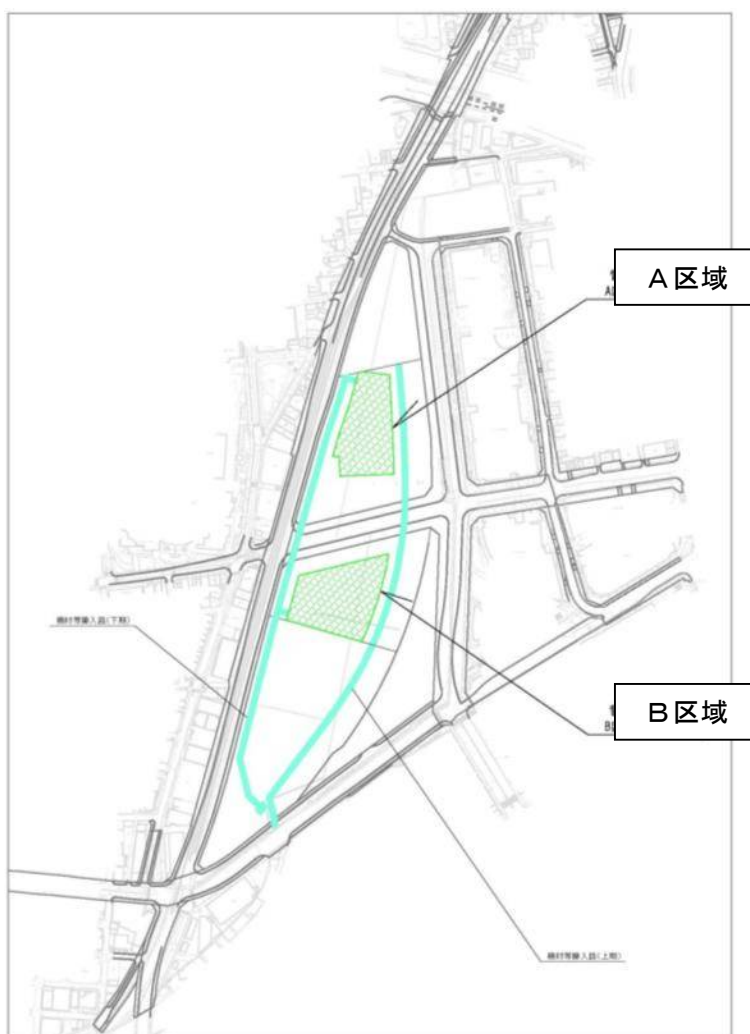
うめきた2期区域 暫定利用対象地 位置図