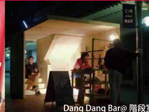
Dang Dang Bar@ 階段室