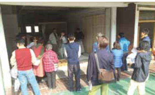
第1回 塗装講座 トップテンハウスの職人さんが丁寧に教えてくれました。通りがかりの人も真剣に聞いていました！