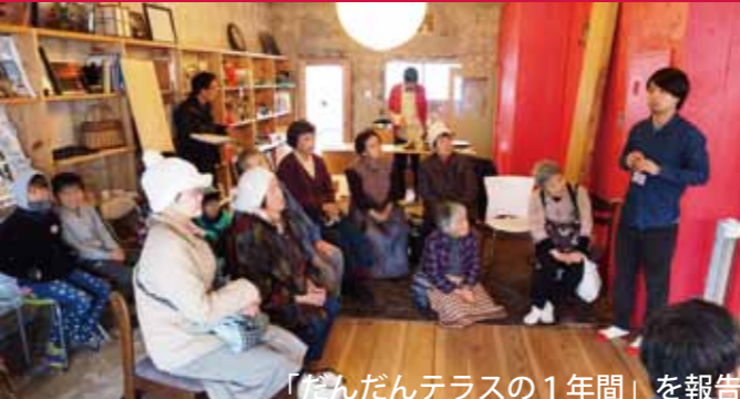
「だんだんテラスの1年間」を報告

「だんだんテラスの1年間」では、だんだんテラス開設の経緯や運営のしくみ、活動が出来たきっかけなどをお話させていただきました。 「Dang Dang Bar」はDIYラボで使っている団地の階段室の原寸模型を使って行いました。自分の住んでいる階段室に突然小さなBarが現れたらどうなる？という遊び心のある実験です。 1Fに住む人は、お風呂の窓から日本酒を注文するなんてこともできるかもしれませんね。 「365日の写真展」は現在も飾っていますので是非ご覧ください。ありがとうございました！