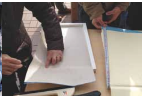
第4回 クロス貼り講座 職人さんにクロスの貼り方を教えて頂いたあとは参加者みんなでタペストリーを作りました！