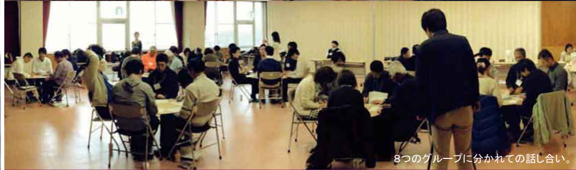
8つのグループに分かれての話し合い。