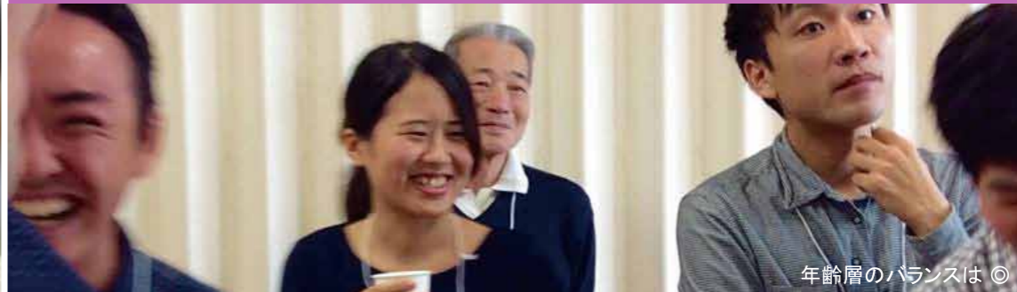
年齢層のバランスは◎

3月1日より「男山やってみよう会議」がスタートしました! 20代から70代までの様々な世代、男山で生まれ育った人や男山のまちづくりに興味のある人といった様々な立場のメンバーが集まり、これから1年間かけて取組んでいきます!