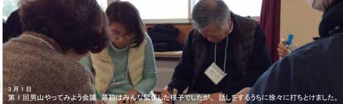
3月1日 第1回男山やってみよう会議 最初はみんな緊張した様子でしたが、話しをするうちに徐々に打ちとけました。

だんだん通信は、365日オープンのだんだんテラスで起きている日々のできごとや地域の情報を発信するための通信紙です。