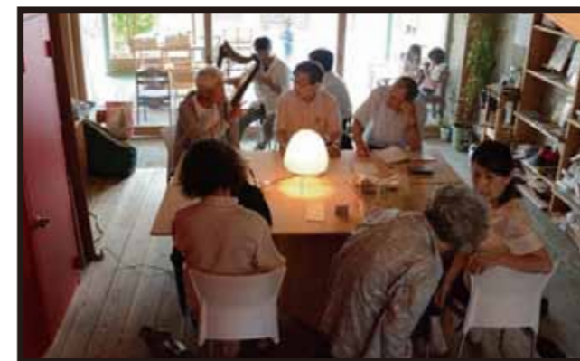
●だんだん句会 先月からだんだん通信にも俳句を掲載しています。テラスで出会った仲間が集まり句会が活動をはじめました！