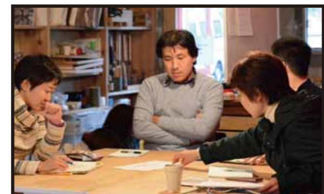
●住まいの相談会 京都府建築士会の協力で月2回、住まいに関する相談会を開催。専門家の意見を気軽に聞く事が出来ます！