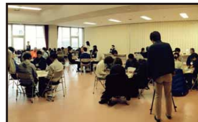
●男山やってみよう会議 男山の魅力を向上させるために公募でメンバーを募集し、始まった会議。月1回会議が開かれています！