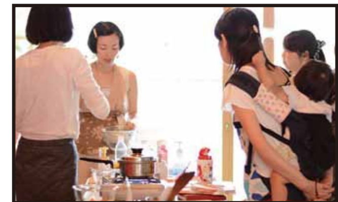
●穂の時間 だんだんテラスを利用して、子育てママ向けの講座（料理、ヨガ、心理学など）を開催しています！