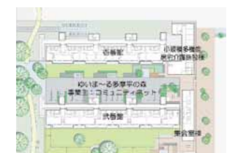
住棟2棟を活用した事例。集会室棟や施設棟が増築されている。

しかし、男山にはだんだんテラスの両側に、元からエレベーターの付いている高層棟があります。この棟の空き部屋を活用して、サービス付住宅として貸し出す。幸い団地内にはすぐ近