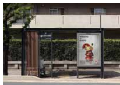
京都市内のバス停。