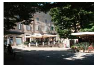
イタリヤ・城壁都市ウルビーノ。花と緑が美しい広場。

京阪バスの1dayチケットはとても便利です。午前中は市役所で用事を済まし、午後は樟葉へ。行く途中一旦バスを降りて、あのおいしいコーヒー店へ寄り、モールで買い物をして帰る、などということが出来ます。