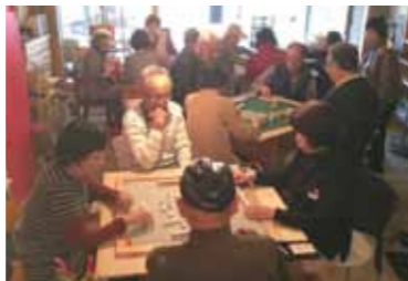
オリジナルの麻雀机は折畳んで片づけられるので、「欲しい」という声が多くの方から届いています！

初心者にもやさしく教えてくれる先生を募集しています！人数が足りない時があるので、ふらっと立ち寄ってくれる方も大歓迎！