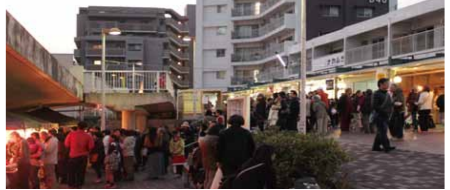
男山秋祭りの様子