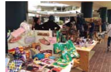
洋裁、和裁、木工、陶器などの手作り作品の作家さんが集まる。地域のお祭りなどにも出展。

《《 活動の経緯は? 》 男山の手作りコミュニティを広げたいという想いで、毎月8日男山中央センター商店街で手作り市を開催しています。 《《 活動の特徴は? 》 手作り品の販売だけでなく、その場でつくれる「教室」も手作り市の中で開催しています。