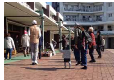
たまたま前を通りがかった人、バスを待つ人、ベランダから参加してくれる人もいます。

クローズアップ だんだんくくく だんだんテラスで活動されている方を紹介 朝10時からのラジオ体操