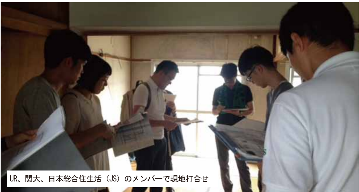
UR、関大、日本総合住生活（JS）のメンバーで現地打合せ

UR都市機構と関西大学団地再編プロジェクトによるリノベーション住戸の設計が始まりました。今年度はA地区の東側のエリア17棟、20棟、24棟の住戸が対象となります。完成した住戸は、来年1月下旬から2月初旬で入居者の募集を予定しています。