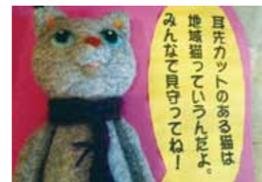
八幡市では、野良猫の避妊・去勢手術費用の一部に補助金を交付しています。

クローズアップ だんだんくくく だんだんテラスで活動されている方を紹介 八幡地域ねこを考える会