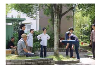
「緑道」を舞台とした活動からまちづくりへ。好奇心旺盛なメンバーが揃っています。

《活動の経緯は？》 魅力的な緑道で遊びたい！ そんなメンバーが集まり、 自由気ままに活動しています。