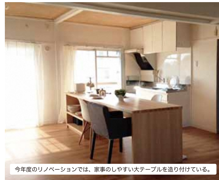
今年度のリノベーションでは、家事のしやすい大テーブルを造り付けている。