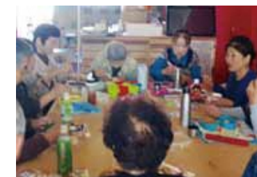
自分でつくったお弁当を持参しておしゃべり。 得意なおかずを交換したり楽しく過ごしている。