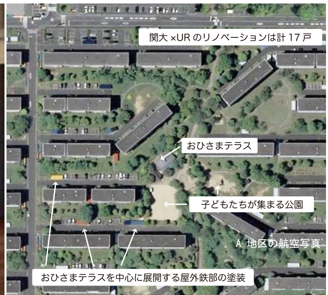
関大×URのリノベーションは計17戸

UR男山団地A地区を対象地とし、集会所を活用した子育て支援施設の開設子育て世帯向けの住戸リノベーション、エントランス改修を実施しました。さらに、共用部の塗装色を住民が自らの意思で選択する屋外空間魅力アッププロジェクトにも取組み、団地の屋外空間も含めた子育て環境の整備を行っています。住戸リノベーションの入居募集期間には、地域内外を問わず多数の見学者が訪れています。入居後には、関西大学団地再編プロジェクトの大学院生によって住まい方に関する追跡調査も実施しており、居住者ニーズやコスト面の検証を行い、他の空き住戸への展開を見据えています。 若年世代が「住みたいと思える団地」を目標に、今後もハードやソフトの取組みを継続していきます。