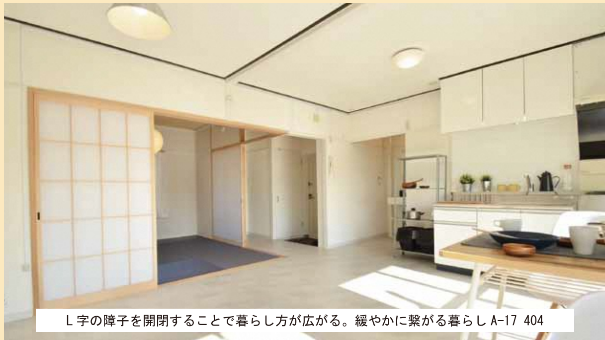
L字の障子を開閉することで暮らし方が広がる。緩やかに繋がる暮らし A-17 404

今年度UR都市機構と関西大学団地再編プロジェクトにより設計したリノベーション住戸が完成し、1月末より入居者の募集を予定しています。今年度のリノベーションは2DKのプランを広々と使えるようにした間取りが特徴。単身者や2人暮らし、子育て世帯が住みたいくなる住まいを目指しました。