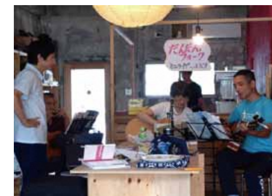
●毎月第3土曜日開催のやってみよう会議は、「自分のやりたいこと」を出発点とした活動を支援しています。

「引っ越してきたばかりでなかなか地域行事に参加できない。参加するきっかけが欲しい。」まちづくりに関心はあるが、きっかけがなく参加できていないという意見もありました。このような意見を踏まえて、気軽に参加できる取り組みを企画したいと思います。