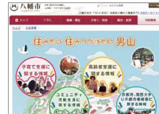
●「男山地域再生基本計画」は、市のホームページから閲覧することができます。

平成26年3月に八幡市が策定しました「男山地域再生基本計画」の認知度については、「知っている」「なんとなく知っている」と答えた人が全体の59.5%という結果となりました。地域に対する不満として「地域情報が行き届いてない」という意見もあり、本紙を通じた情報発信に力を入れたいと思います。