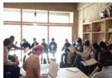
だんだんフォークのメンバーの生演奏に合わせて、みんなで歌います。

だんだんくくくだんだんテラスで活動されている方を紹介 だんだんみんなで歌ってみよう