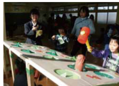
小学生や幼稚園のお友達、遊びに来てね！ 優しいお兄さん、お姉さんがサポートします！

ものづくりを通じた交流拠点として、地域の様々な方と協働してラボを盛り上げましょう！ みんなのスキルを持ち寄って新しいものを生み出そう！ 2月には八幡支援学校高等部と3月にはおもちゃ病院とコラボレーションしたイベントも企画しています！