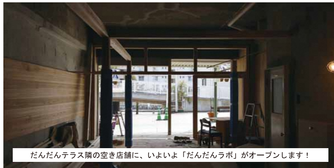
だんだんテラス隣の空き店舗に、いよいよ「だんだんラボ」がオープンします！

2月4日(日)にオープンする「だんだんラボ」でオープニングイベントを開催します！ だんだんラボができた経緯やUR男山団地で先駆的に進んでいる「ココロミタウン」プロジェクトについて、リノベーションした住戸の写真や手作り作品の展示をする予定です！みなさま是非「参加ください！」