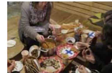
第1回「フィンランド料理」では、フィンランドに留学経験のある方が参加してくれました。

第三十九回だんだん旬会 選句 幾千の駄句鎮魂の初詣 北海の荒波の雲丹膝に墮つ りしよう さよー