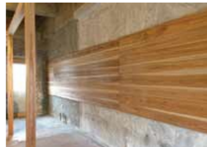
写真や絵画、立体物の展示也大歓迎です！ ギャラリーの利用希望者はだんだんラボまで！

例えば、この長い壁はギャラリーとして利用していただけます！「こんな風に使ってみたい」というアイデアがあれば、どんどん意見をください！