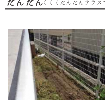
今から何を植えようか考えるのが楽しみですね。夏頃にはいろんな野菜ができていますかも。