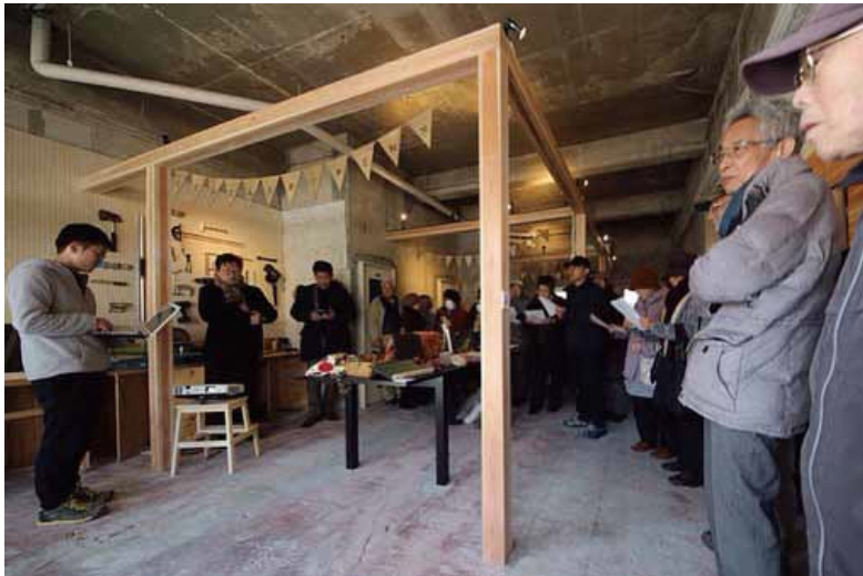
オープンイベントの様子 ラボで使用可能な工具は様々。レーザーカッターといったデジタル工作機器の他、ボール盤、ベルトサンダ、サンドブラストができる工具等マニアックなものも多数。

「引越してきたばかりで地域のことかわからない」「知り合いがおらず頼れる人がいない」といった日本人の方がだんだんテラスに訪れることもあり、「外国人」に限るテーマではないと言えるかもしれません。