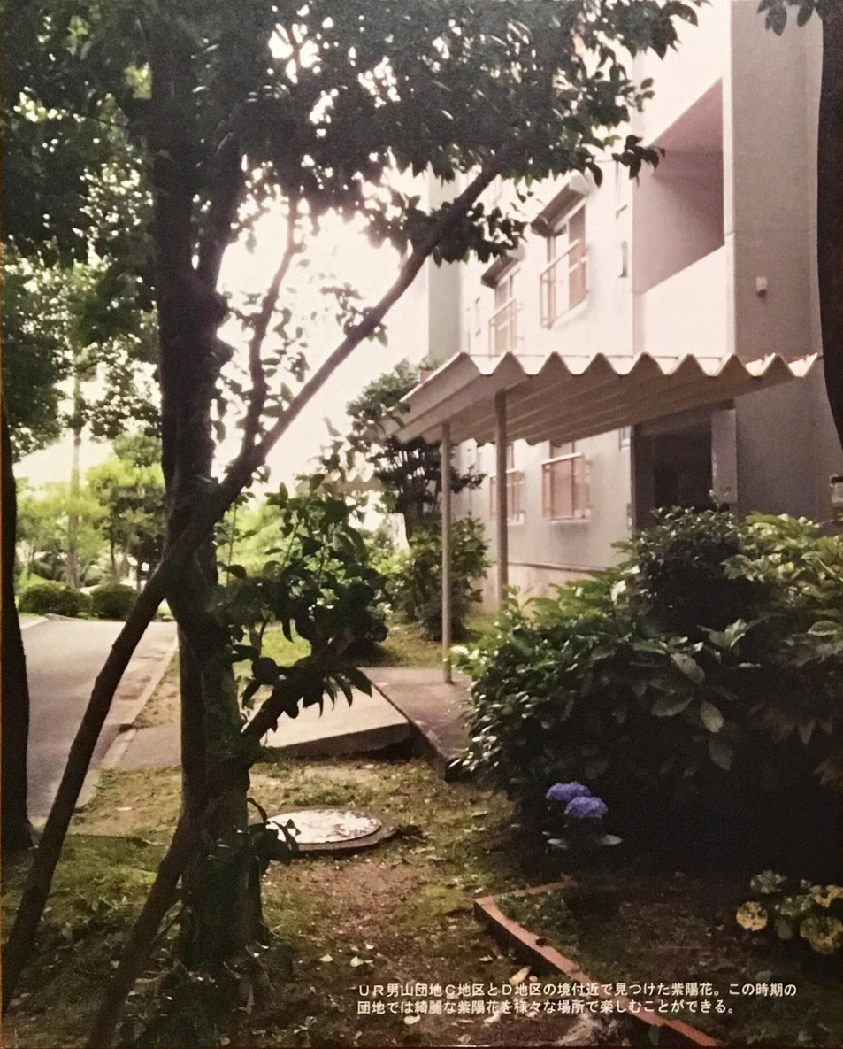
UR男山団地C地区とD地区の境付近で見つけた紫陽花。この時期の団地では綺麗な紫陽花を様々な場所で楽しむことができる。

だんだん通信は、365日オープンのだんだんテラスで起きている日々のできごとや地域の情報を発信する月刊誌です。