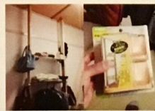
初心者でも簡単にDIYできる商品が、ホームセンターで手軽に買うことができます!

「この板を切ってもらえませんか?」家にあった端材を使って棚板をつくりたいとだんだんラボに来られた女性。C地区にお住まいで色々DIYを楽しんでいると聞きお家にお邪魔しました。「これが賃貸の団地には便利!」と自由自在に柱を立てれる商品を見せてくれました。