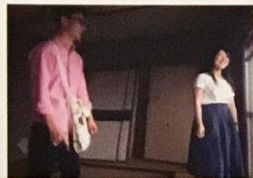
関西大学建築学科の学生9名が3つの住戸を設計します。