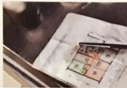
B地区は、南北に伸びる3DKのプランで建築。