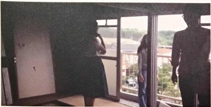
UR都市機構と関大のリノベーションでは、窓から見える景色にこだわりを持って住戸を選んでいる。

「高齢者が気軽に集まり、相談できる場をつくりたい」「大人が絵本を読む機会をつくって、絵本の素晴らしさを伝えたい」「団地の屋外でヨガ教室をしたい」とな色んな想いに触れる機会となりました。やってみよう会議は、誰もが参加自由な場ですので、「こんななど地域でやりたい」という想いをもちの方は、気軽に1人参加ください。