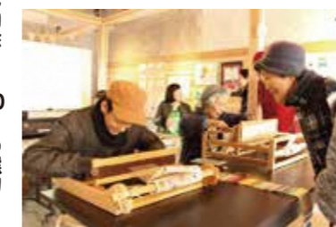
支援学校の生徒さんがラボで実演。授業ではコースター等の製品を製作しています。

毎週火・木曜日 10:30~11:30 に 京都八幡支援学校の生徒さんがさをり織りの実演・体験の場を開いています。さをり織りは、素材や織り方を自分の思いのままに織るといった理念があります。世界に1つだけのオリジナルを体験しにきてください!