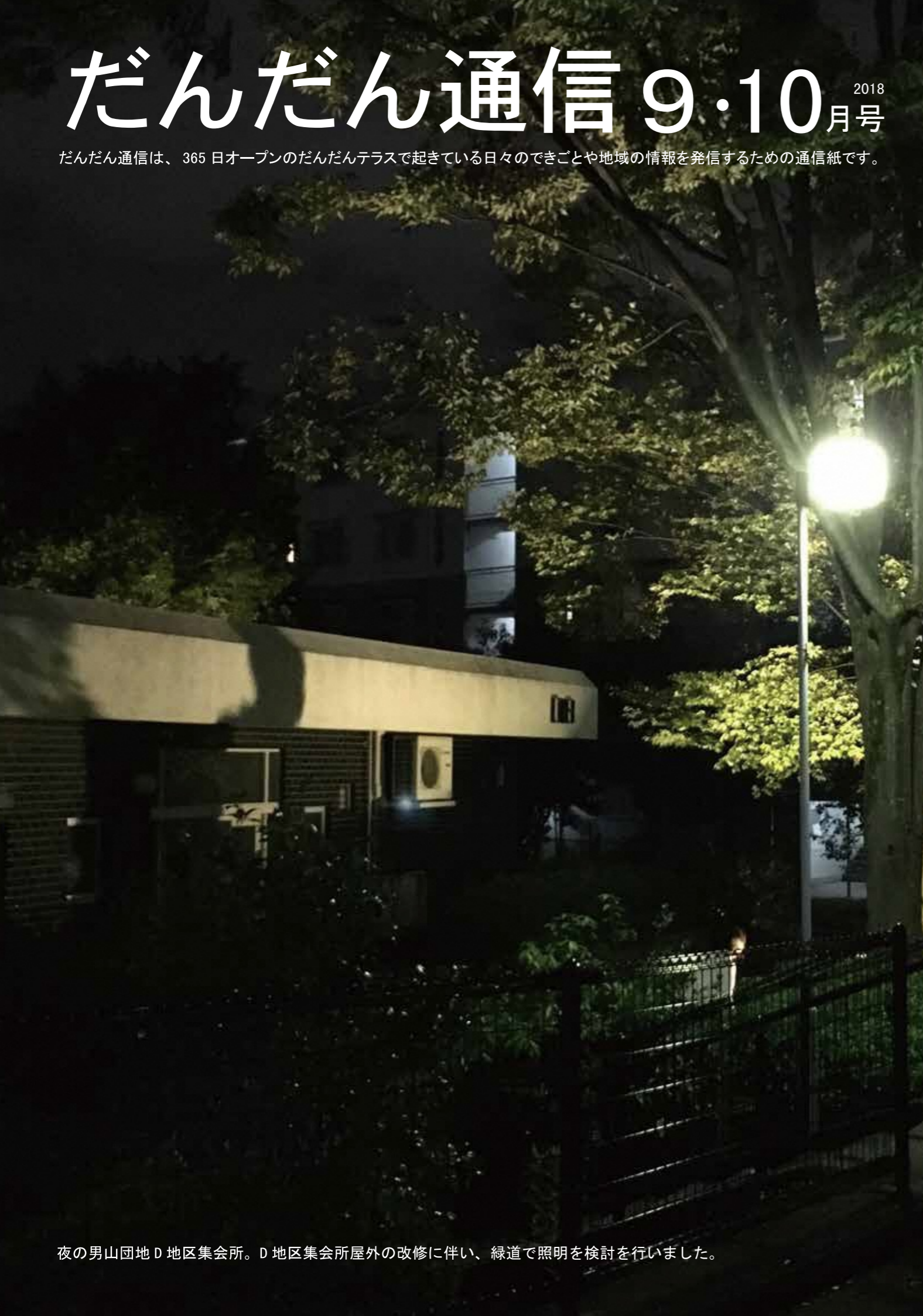
夜の男山団地D地区集会所。D地区集会所屋外の改修に伴い、緑道で照明を検討を行いました。

だんだん通信は、365日オープンのだんだんテラスで起きている日々のできごとや地域の情報を発信するための通信紙です。