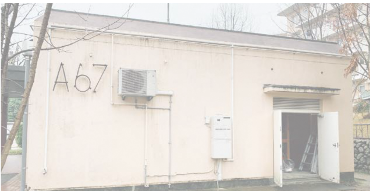
A地区集会所倉庫と外の小さな広場が一体で使えるような場所へデザイン。

男山団地初の試みとなる、住民協働型の集会所リノベーションプロジェクトをA地区で実践。今年の夏より、多様なメンバーで集会所の活用方法について話し合いを重ね、共同キッチンへ改修する計画となりました。3月末頃に完成予定です。