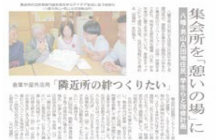
H30. 10. 27 の京都新聞で掲載されました。