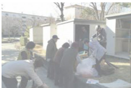
工事前に倉庫の物はみんなで片付けます。