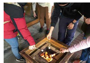
お芋やマシュマロを持参してきてくれる人も！

本格的な冬の到来に備え、DIY 囲炉裏をつくりました！ ラボで出てくる端材を燃料にして、せっせと灰をつくっています。 囲炉裏で暖をとっていると、どこからともなく人が集まります。