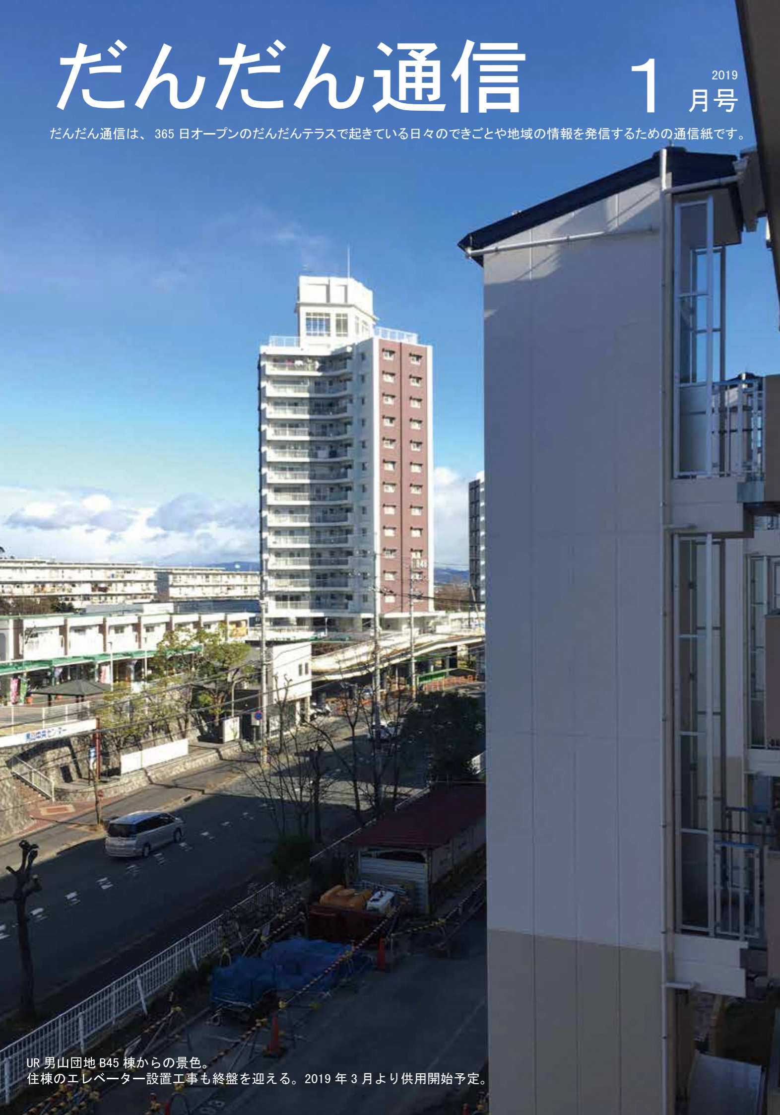
UR 男山団地 B45 棟からの景色。 住棟のエレベーター設置工事も終盤を迎える。2019年3月より供用開始予定。

だんだん通信は、365日オープンのだんだんテラスで起きている日々のできごとや地域の情報を発信するための通信紙です。