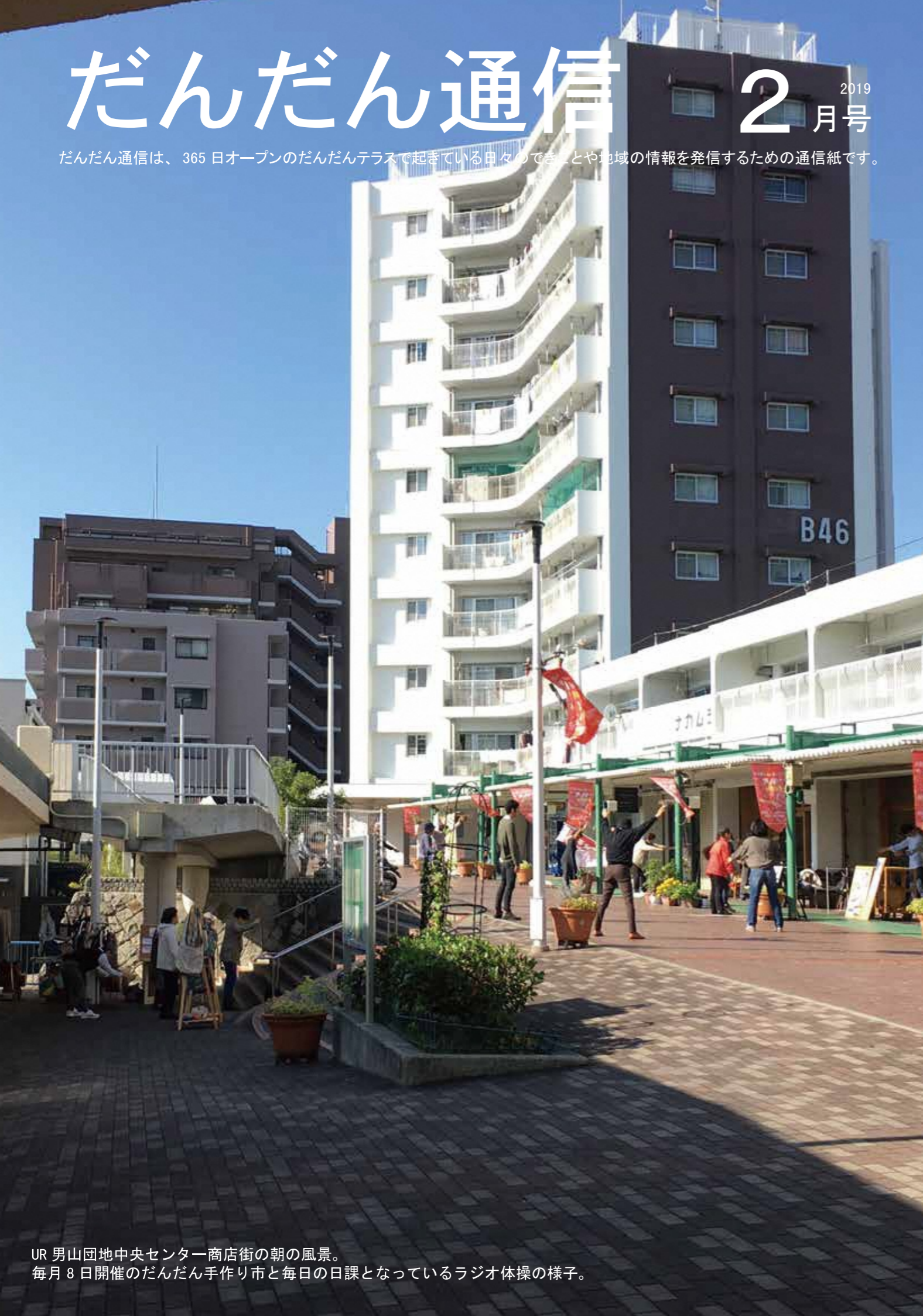
UR 男山団地中央センター商店街の朝の風景。 毎月8日開催のだんだん手作り市と毎日の日課となっているラジオ体操の様子。

だんだん通信は、365日オープンのだんだんテラスで起きている日々のできごとや地域の情報を発信するための通信紙です。