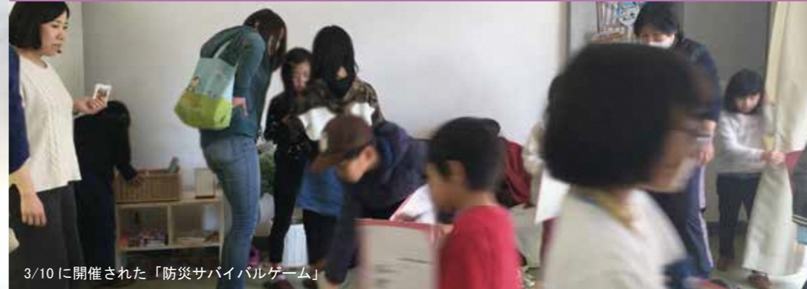
3/10に開催された「防災サバイバルゲーム」

住みたい、住み続けたい男山地域であるために、幅広い世代が集い、まちづくりについて話し合い、具体的な取組みを重ねる「男山やってみよう会議」4月で5年目を迎え新たにメンバーを募集します。詳細は中面、折り込みの記事を確認してください。