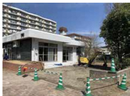
石の腰壁をカットして開放的な入口に