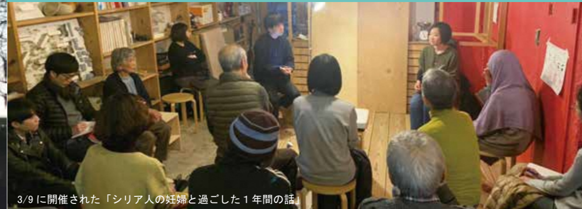
3/9に開催された「シリア人の妊婦と過ごした1年間の話」

「男山やってみよう会議」は、この4月で5年目を迎えます。これまで、計17のチームがこの会議から生まれました。毎月第3土曜日に開催する会議も50回を超え、いくつもの話し合いを重ねてきました。3月は「外国人支援」の取り組み、「防災」の取り組みが開催されました。どちらも大勢の参加者が訪れ、賑わいのあるイベントとなりました。毎月第3土曜日（4月のみ第4土曜日）にぜひご参加ください。