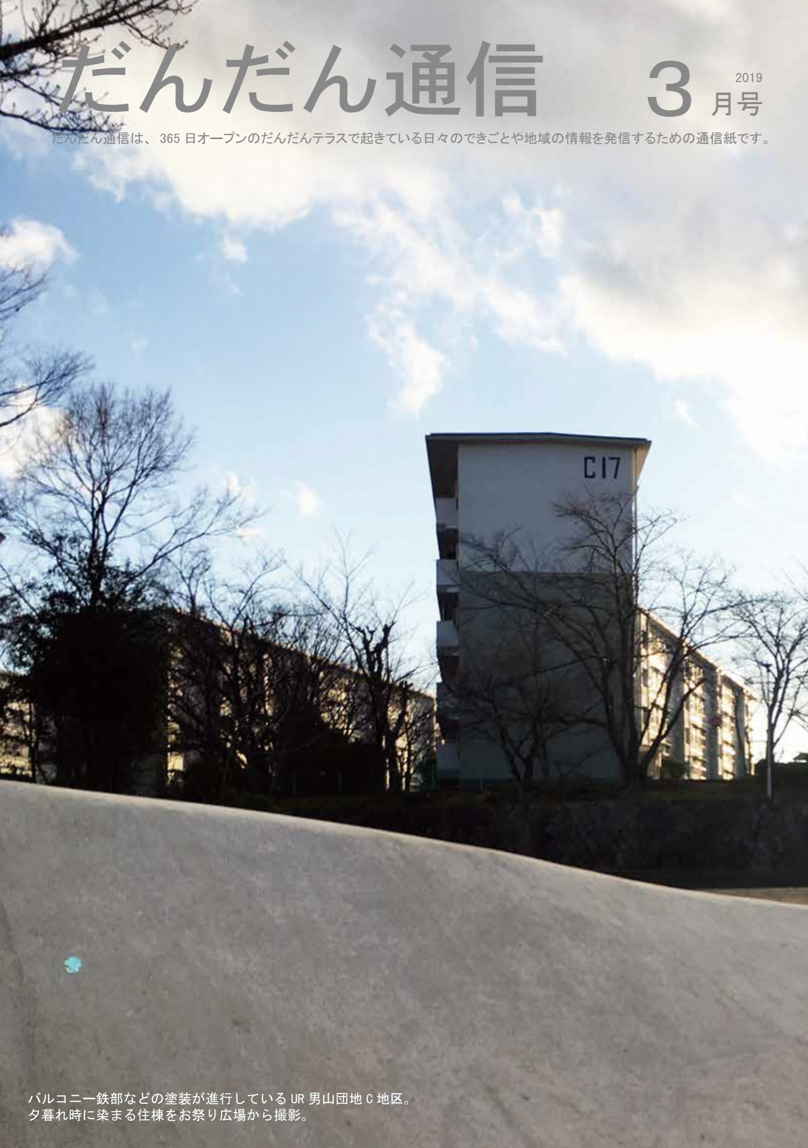
バルコニー鉄部などの塗装が進行しているUR 男山団地C地区。夕暮れ時に染まる住棟をお祭り広場から撮影。

だんだん通信は、365日オープンのだんだんテラスで起きている日々のできごとや地域の情報を発信するための通信紙です。