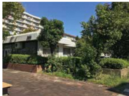
生き茂った低木の植栽

バルコニー手すりなどの鉄部塗装は、数年おきに行われている定期的な修繕工事ですが、今回初めて色彩計画の中で、屋外環境に配慮した塗装色を採用しました。少しずつですが、心地よい屋外環境づくりに取り組んでいます。