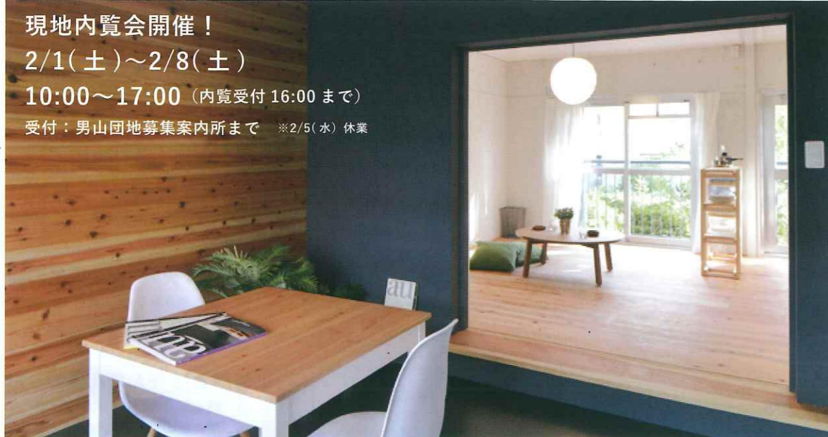
縁側のある住まい C15-107 型式：1R

今年度UR都市機構と関西大学団地再編プロジェクトにより設計したリノベーション住戸が完成し、2月9日に入居者の募集を予定しています。今年度のリノベーションは、昨年度に続き一部DIYもできる自由度の高い間取りに加え、新しく「1階住戸」でのリノベーションに挑戦。1階の良さを活かし、新しい暮らしが実現できる住まいを目指しました。