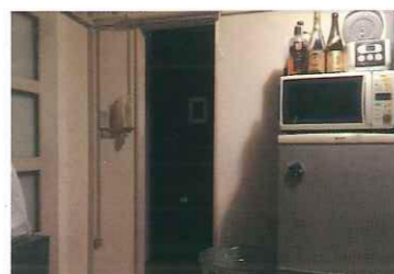
DIY住宅は、躯体を除く壁を解体することが可能。だんだんラボの電動工具を使い工事をしました。

DIY住宅なので、キッチンから和室につながる壁を大胆に解体しました!廊下にでなくても、部屋と部屋を移動できるようになり、格段に使いやすくなりました!