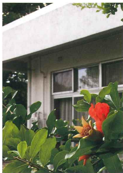
兼題：ザクロの花 応募数：35句 入選数：5句