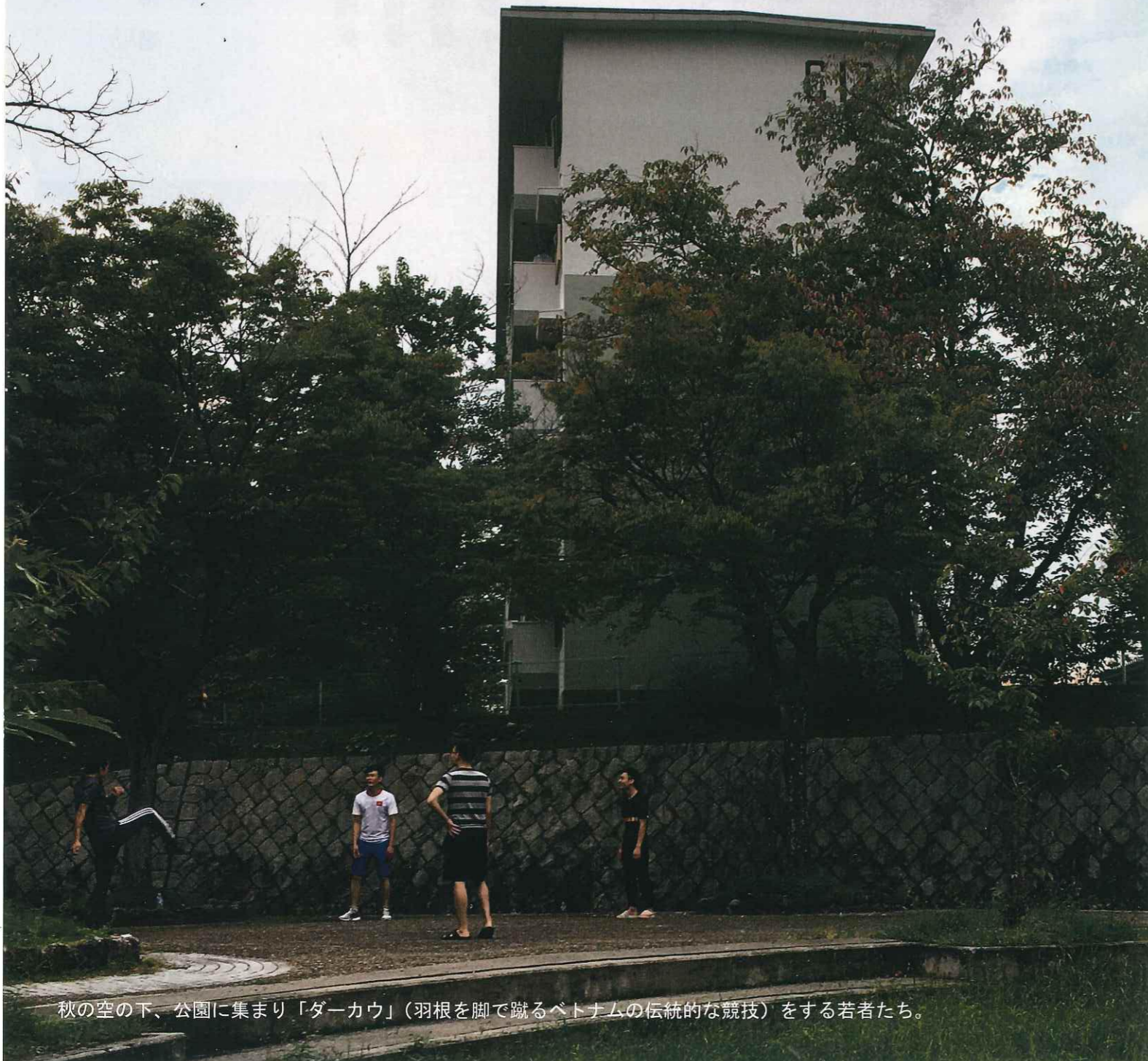
秋の空の下、公園に集まり「ダーカウ」(羽根を脚で蹴るベトナムの伝統的な競技)をする若者たち。

だんだん通信は、365日オープンのだんだんテラスで起きている日々のできごとや地域の情報を発信するための通信紙です。