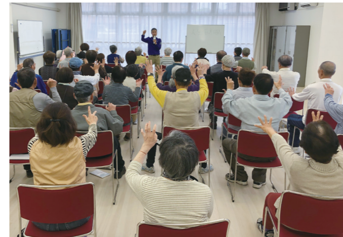
元気づくり体操講座／新豊里団地

団地内の集会所等を活用し、多世代交流の機会の創出や生活支援サービス機能の導入を進めています。