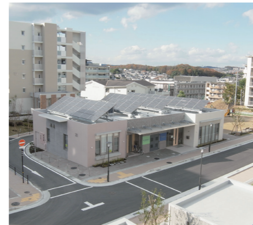
奈良市二名地域包括支援センター／奈良学園前・鶴舞団地

団地を含む地域全体で在宅医療・介護サービス等が受けられる、安心して住み続けられる環境づくりをめざしています。