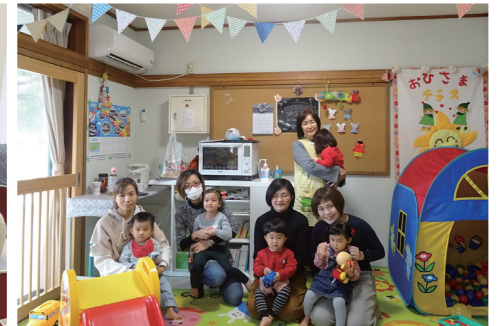
地域子育て支援施設「おひさまテラス」／男山団地