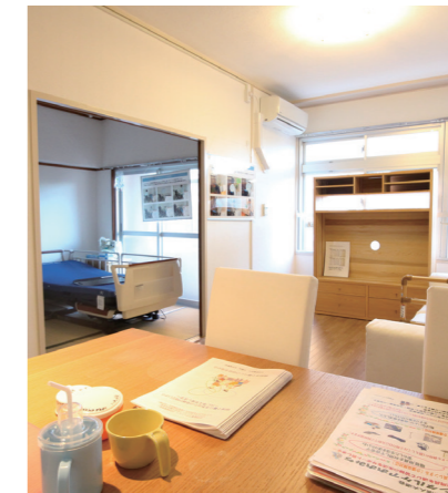
在宅療養・介護リハビリモデルルーム／森之宮第2団地

高齢者に対応した住宅や子育て世帯を支援する住宅等、幅広い世代や多様なニーズに対応した住宅の整備、共用部分のバリアフリー改修等を進めています。