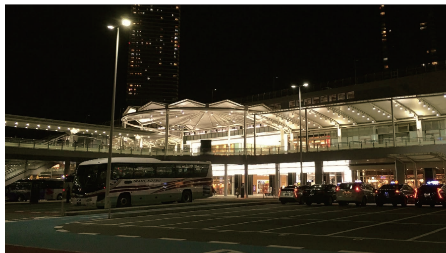
JR広島駅新幹線口ペデストリアンデッキ

JR広島駅周辺の回遊性を高め、交通結節点の強化を図るべく、URは広島市からの要請に基づき、当地区の関連公共施設として、「駅自由通路」及び「ペデストリアンデッキ」の整備、並びに新幹線口広場の再整備を行い、世界からの来訪者を迎える広島にふさわしい玄関づくりに貢献しました。