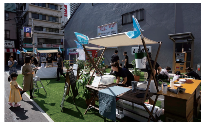
道路や青空駐車場を借用した社会実験の様子

中国地方で4番目の人口を誇る広島県福山市。その顔となるのが、福山城に隣接し、新幹線のぞみも停車するJR福山駅です。しかし、合併等により市街地が郊外に分散した結果、空き店舗が目立つ都市のスポンジ化が起こり、その再生が急務になっています。URはJR福山駅前において、福山市のめざすリノベーションまちづくりによる再生への支援として、まちづくり用地の取得による民間リノベーションの促進や、「居心地がよく歩きたくなるまちなか」をめざした社会実験などを実施しています。