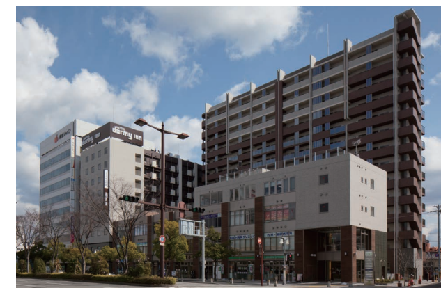
和歌山けやき大通りの街並

和歌山市のメインストリートであるけやき大通りに面した当地区では、経済情勢の悪化により再開発事業が停滞していました。そこでURが事業完遂のため共同施行者として参画し、技術的支援・住宅保留床の取得・民間事業者への公募・譲渡等を実施。これにより事業は再始動し、美しいけやき大通りの街並み景観創出にも寄与することができました。