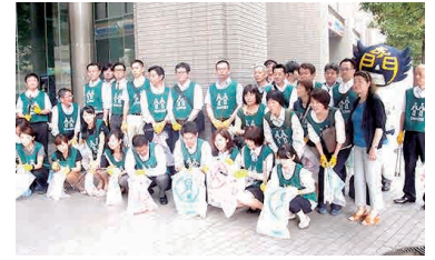
エリアマネジメントによる清掃活動の様子