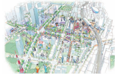
まちの将来像 (新橋・虎ノ門地区まちづくりガイドライン(R元.7))

「環状2号線周辺地区まちづくりガイドライン(H24.3)」、 「都市再生整備計画 環状2号線周辺地区(H25.3)」の策定支援(港区より受託) 「新橋・虎ノ門地区まちづくりガイドライン(R元.7)」の策定支援(港区より受託)