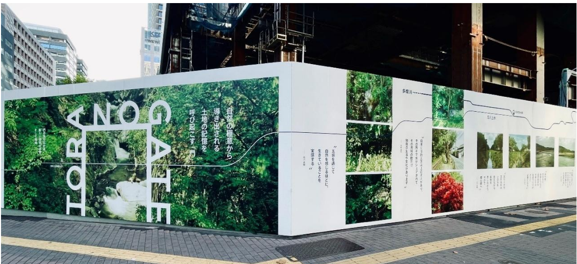
「TORANOGATE」の仮囲いアート・デザイン