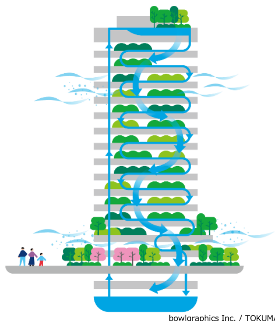
「超高層循環水景システム」イメージ図

屋上庭園に水を溜め、その水が壁面を蛇行しながら流れ落ちる『超高層循環水景システム』を採用。水平方向の川の流れや緑のつながりを垂直方向の都市風景に投影しました。南側壁面が広大な緑地帯となり、都市やオフィスの温度を下げる冷却効果も発揮する画期的なビルとなります。