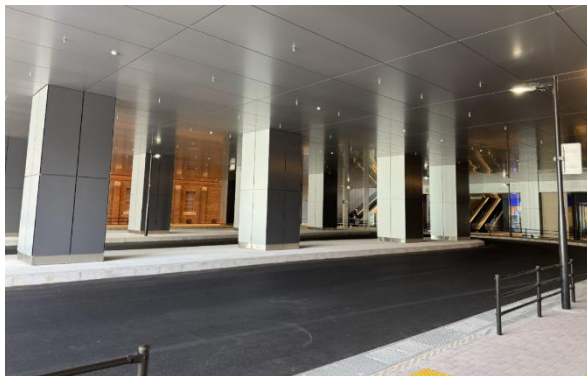
令和8年3月25日に供用開始した交通広場