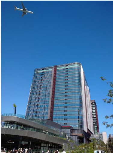
多くの来訪者で賑わう「OIMACHI TRACKS」

独立行政法人都市再生機構（以下、UR都市機構）が大井町駅周辺で施行している「広町二丁目土地区画整理事業」（以下、本事業）において、東日本旅客鉄道株式会社（以下、JR東日本）および東急電鉄株式会社と連携し、整備を進めてきた東急大井町線高架下の歩行者専用通路（歩行者専用4号通路。以下、4号通路）が、令和8年6月30日（火）に供用開始します。