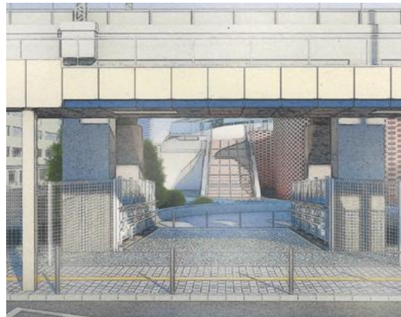
東急大井町線高架下に整備した歩行者専用4号通路 ※東急電鉄様より提供イラスト（完成イメージ図）

引き続き関係者と連携しながら、本事業を着実に推進するとともに、地域の特性や関係権利者の意見を尊重し、安全で快適なまちづくりの実現に向けて、取り組んでまいります。