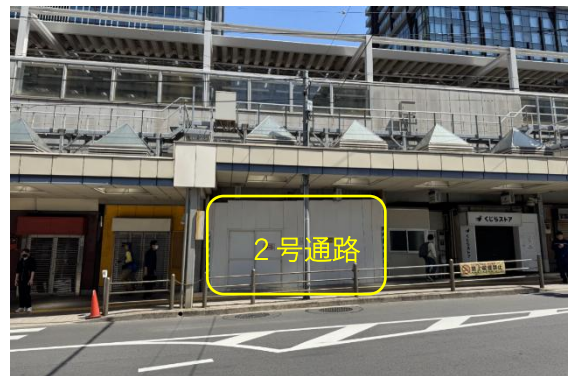
令和8年12月頃に供用開始予定の歩行者専用2号通路

本事業で整備し、令和8年3月25日に供用開始した交通広場では、タクシー乗り場の運用が開始され、交通結節点としての機能向上が進んでいます。