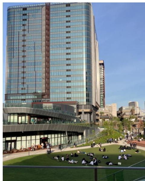
憩いと賑わいを創出する「TRACKS PARK」

「TRACKS PARK」は、地域をつなぐ核として、平時は憩いと賑わいを創出する広場空間として、災害時は行政機能ゾーンやしながわ中央公園と連携した地域の防災拠点となる空間を形成しています。