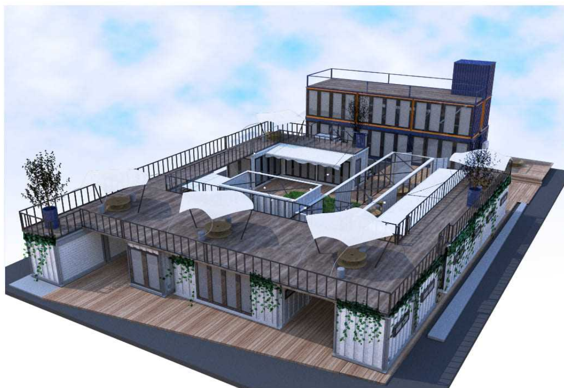
Craft Village NISHIKOYAMA

今後、ピーエイを主体としてUR都市機構が協働し、地元の方々の協力のもと、当施設での活動を展開していく予定であります。