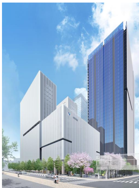
【完成イメージ】業務棟は右手奥建物

今般の募集は、UR都市機構が業務棟について民間事業者のノウハウ及び技術力を最大限に活用することを目的に実施するものです。