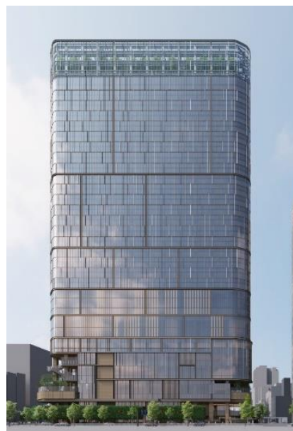
イメージパース（北側）

本事業では、スマートビルプラットフォームを中核とし、センサー類を接続するためのネットワークをはじめ、ビル内のさまざまな設備を連携させることで、「人」を中心に据えた次世代型ワークプレイスの創出とさまざまな社会課題解決に向けた取り組みを推進します。