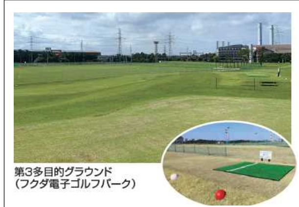
第3多目的グラウンド (フクダ電子ゴルフパーク)