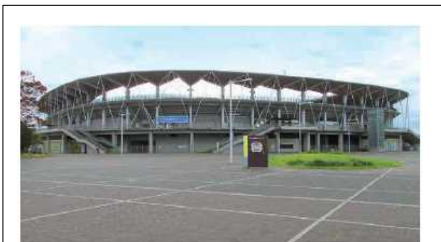
球技場(フクダ電子アリーナ) 2007年グッドデザイン賞受賞