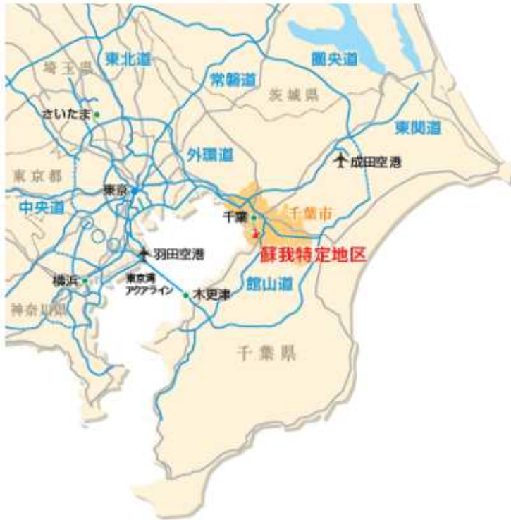
蘇我特定地区の位置と道路網