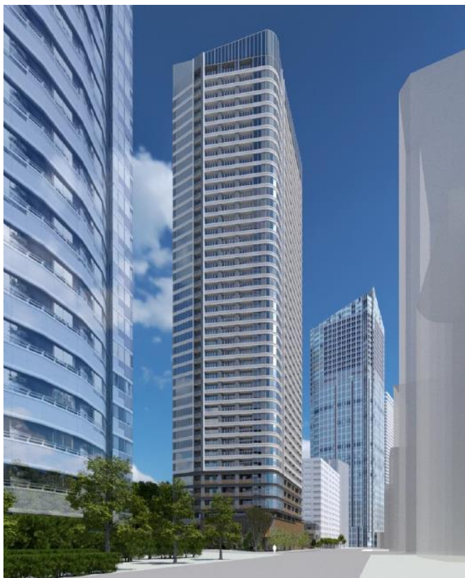
【イメージパース(外観)】