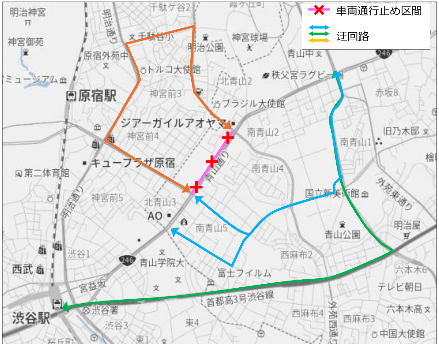
地図 「PL21001」