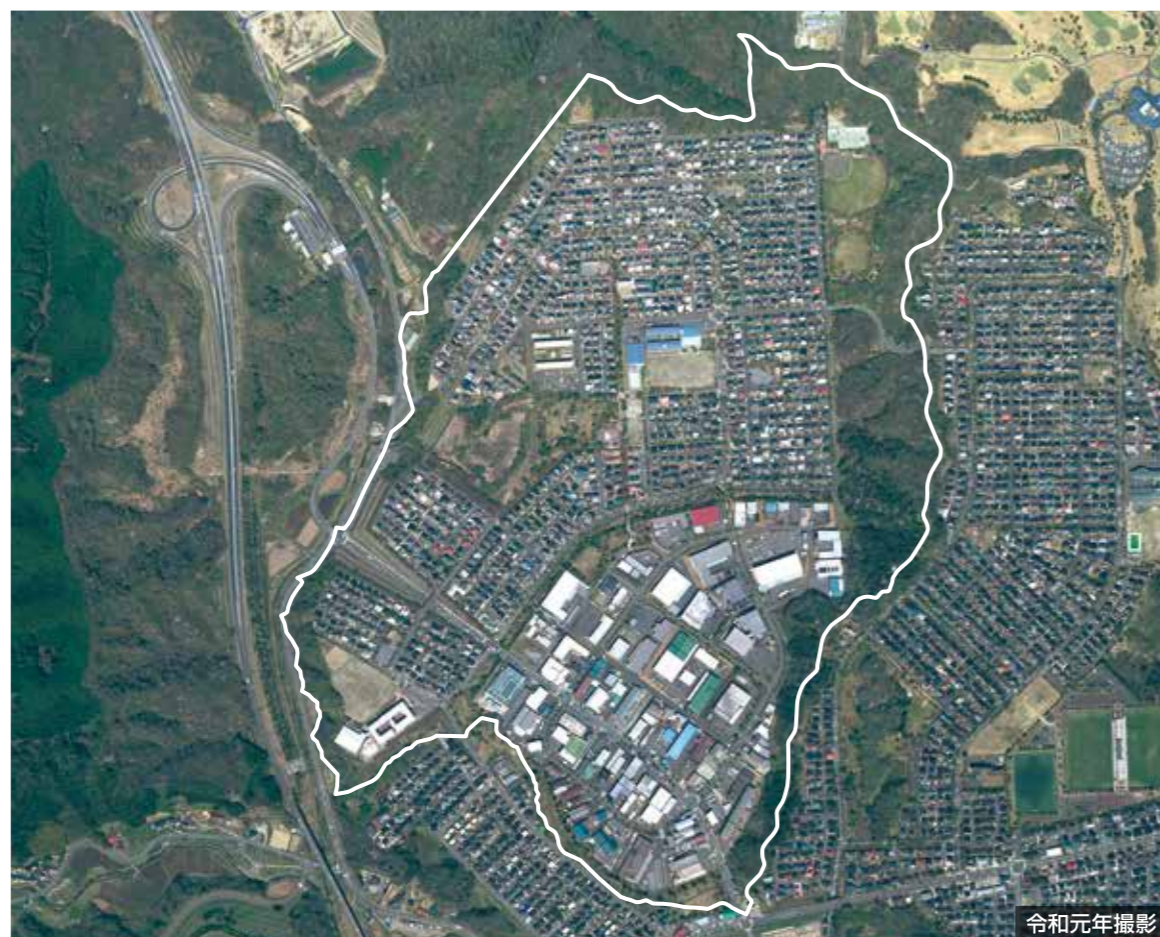
令和元年撮影