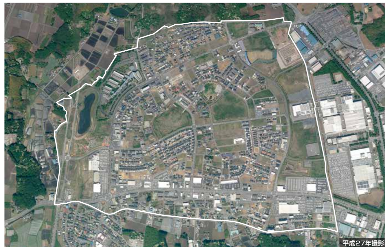
平成27年撮影

宇都宮テクノポリスセンター地区、ゆいの杜は、鬼怒川左岸台地の豊かな自然と工業集積の高い工業団地に囲まれ、宇都宮テクノポリス開発計画の拠点地区として位置づけられ、「産・学・住・遊・緑のまちづくり」をコンセプトに開発整備が進められました。多彩な機能を融合させ、高質な都市基盤の整備に加え、街なみの賑わいや生活の利便性、地域の景観、住環境などにも配慮したまちとなっています。