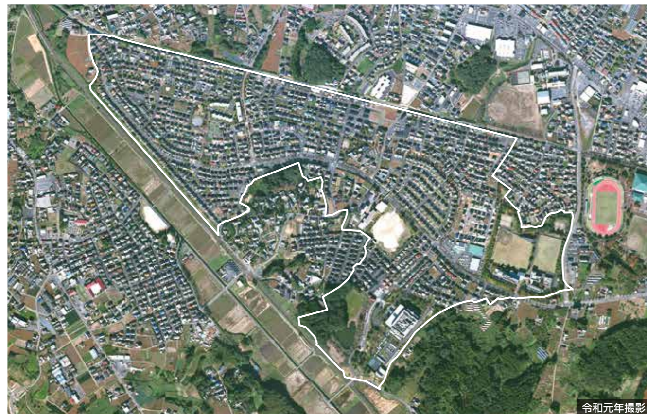
令和元年撮影

南台地区、フローラルシティ石岡南台は、東京都心から70km圏、茨城県南部の石岡市に位置しています。筑波研究学園都市に近い立地条件を考慮し、地域にふさわしい業務施設を同時に立地させる複合都市機能づくりを目指しました。「里の花・ひらく街」をまちづくりコンセプトに、「街づくりは花づくり」「花づくりは人づくり」「人づくりは街づくり」をサブテーマに事業が進められました。「花」をテーマにしたまちづくりを行い、「花」を媒体として、街並み形成のための仕組みやルールが設定されました。